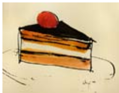
72 Tortenstück, 2000 Aquarell/Tusche 19cm x 22cm