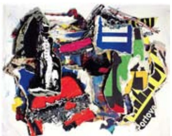
46 Dentro un'altra realtà II, 1994 3D-Collage in Kastenrahmen 80cm x100cm x8cm