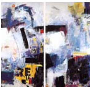
44 Liberi come ladri nella notte, 1995 200cm x 200cm (je 200cm x100cm) Acryl/Collage/Kunstharz auf Zinkblech zweiteilig Zinkblech auf Sperrholz, Acryl, Collage