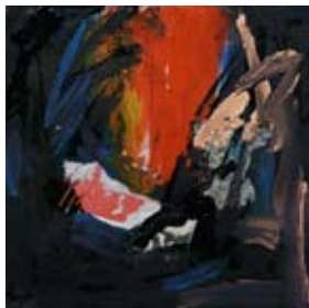
99 Ohne Titel, 1994 Acryl, Collage auf Papier 30cm x 30cm