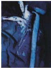
26 Early mornign in New Canaan, 1999 Radierung/Aquatinta 29cm x 21,5cm