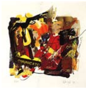
42 Communicato, 1994 Serigrafie/Collage 80cm x 80cm