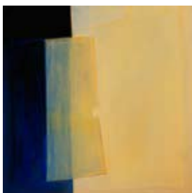
101 Colonata, Carrara II, 1992 Pastell 60cm x 60cm