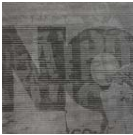
96 NO, 202 Radierung 16,5 x 16,5cm Epreuve d'Artiste (Unikat)