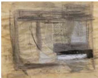
28 Tavarnelle II, 1998 Gouache/Tusche/Bleistift auf Ingrepapier 38cm x 45cm