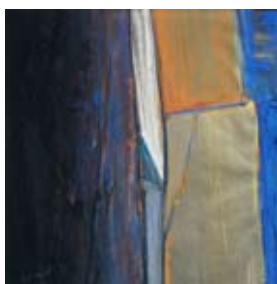
32 Fantiscritti, Carrara, 1991 Pastell/ Gouache 36cm x 36cm