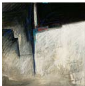
100 Colonata, Carrara II, 1992 Pastell 52cm x 52cm