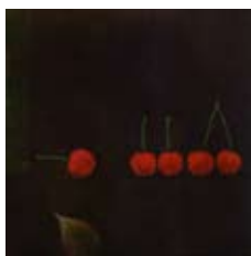
73 Geburt im Herbst, 1981 Mezzotint 11,5cm x 11,5cm