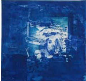
27 Valley d'octobre 1996 Radierung/Aquatinta 27cm x 29cm Unikat