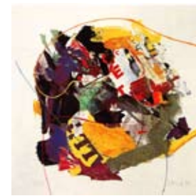
43 Un angolo di feicità Serigrafie/Collage 80cm x 80cm