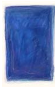
40 Ohne Titel, 1996 Pastell auf Aquarell 51cm x 75cm