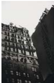
70 The Plaza, 1989 Radierung/Aquatinta 50cm x 32cm