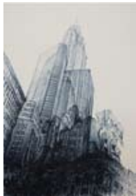
71 Empire State Building, 1990 Lithografie 100cm x 70cm Ep. d'Artiste Edition nur 10 Exemplare