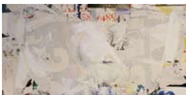
45 San Francisco Bay, 1995 Acryl/Collage auf Zinkblech 100cm x 2000