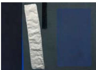
102 Ohne Titel, 1991 Pastell/ Gouache auf handgeschöpftes Papier 49cm x 67cm