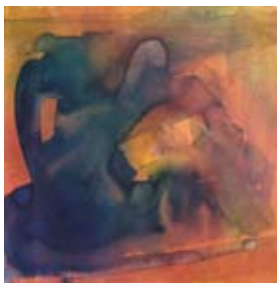
31 Monti Sibillini, 1999 Tusche/ Aquarell auf Papier 47cm x 47cm