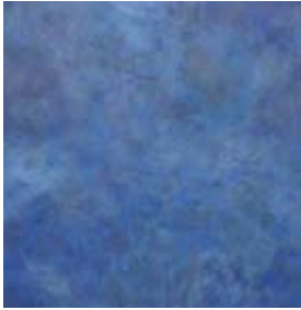
41 Differenzierte Monochromie, 1993 Acryl auf Leinenl 80cm x80cm