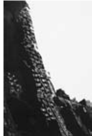
69 Park Lane Hotel, 1989 Radierung/Aquatinta 50cm x 32cm