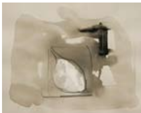
29 Tavarnelle III, 1989 Gouache/ Bleistift 29cm x36cm