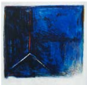
30 Signaux inattendus, 1993 Radierung/Aquatinta 34,5cm x 34,5cm Edition: 50 Ex. jedes Blatt individuell handkoloriert Auflage für die Zeitschrift Construire