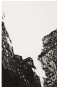
68 57th Street II, 1989 Radierung/Aquatinta 50cm x 32cm