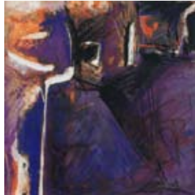
97 Ohne Titel, 1996 Pastell auf Aquatinta, 31cm x 31cm